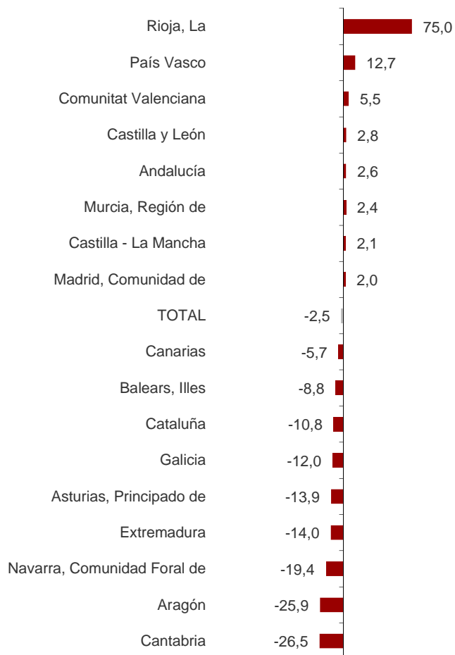
Variación anual del número de sociedades mercantiles creadas por comunidades autónomas. Junio 2018