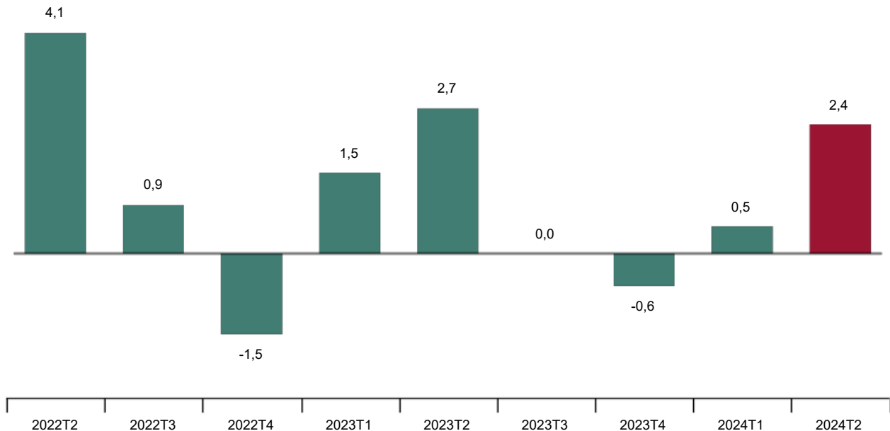
Tasa trimestral del Índice de Precios del Sector Servicios Índice general. Porcentaje

Enlace a esta nota de prensa: https://www.ine.es/dyngs/Prensa/es/IPS2T24.htm