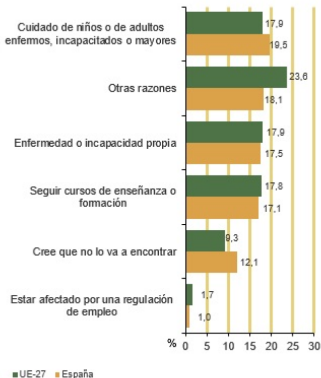
Mujeres inactivas. Razones de la inactividad. 2023