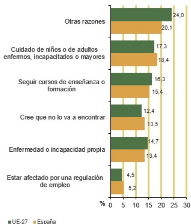
Mujeres inactivas. Razones de la inactividad. 2021