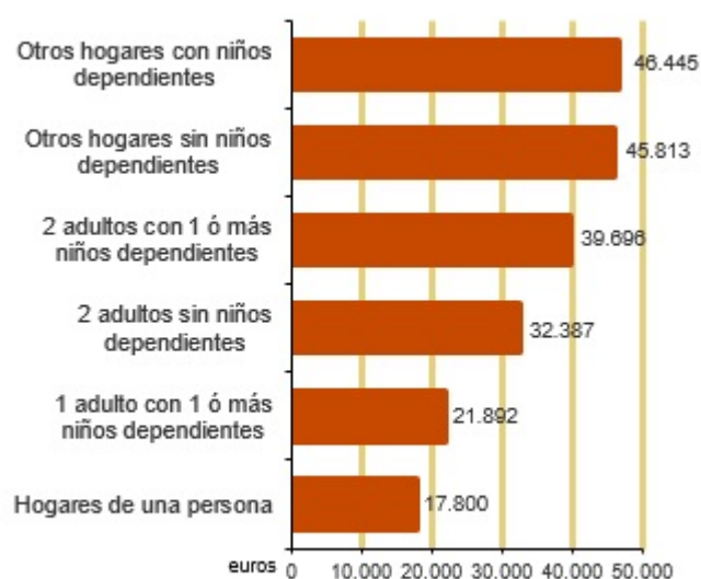
Renta anual neta media por hogar según tipo de hogar. 2022