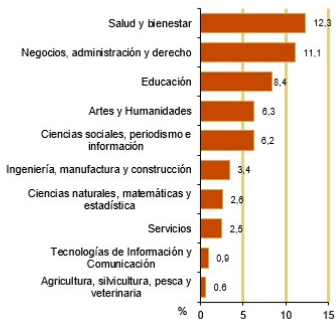
Mujeres graduadas en educación superior. España. 2022